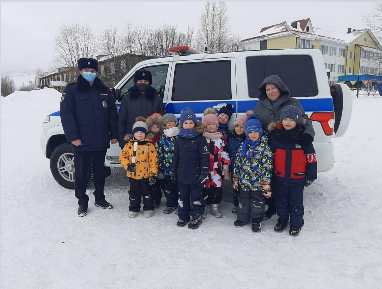
Беседа с детьми «Встречаем весну безопасно»