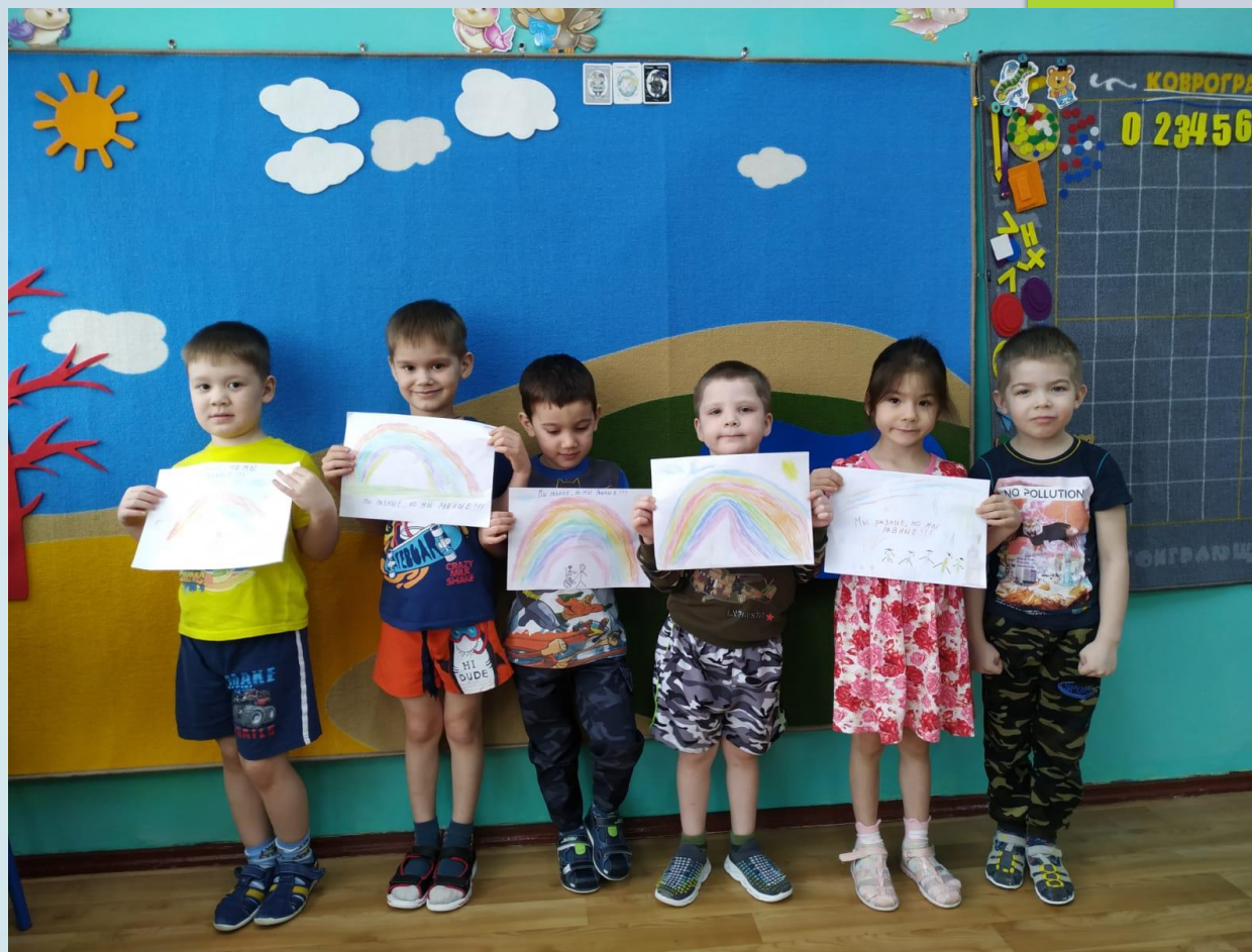
Рисунки на тему «Встречаем весну безопасно»