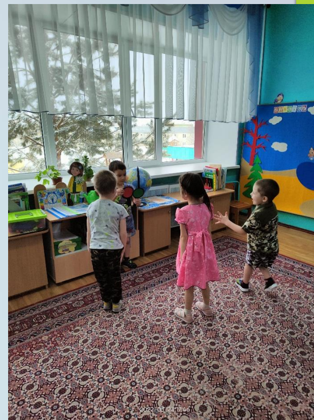
Подвижная игра «Светофор»