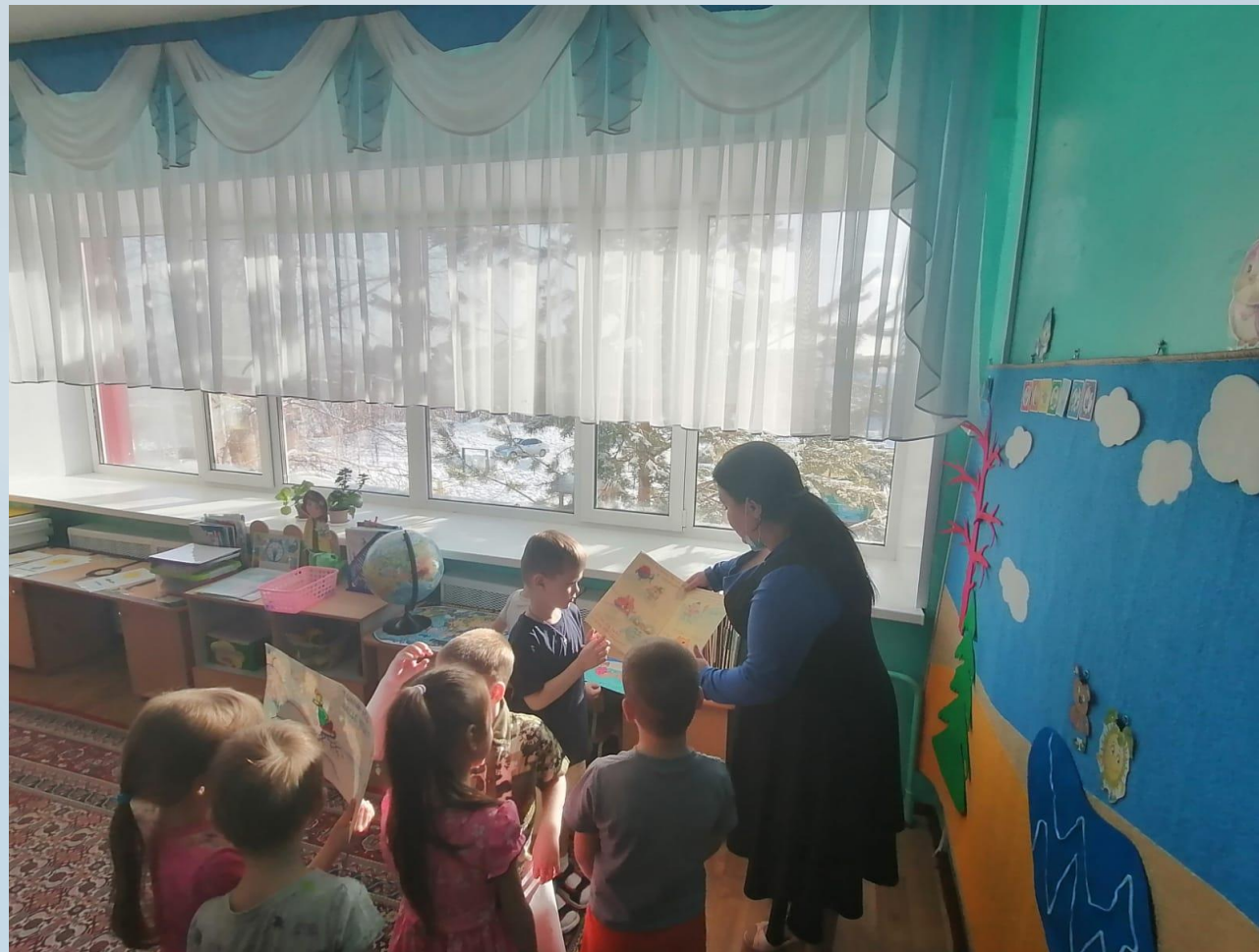
НОД «Опасные ситуации, которые могут подстергать детей в весеннее время года»