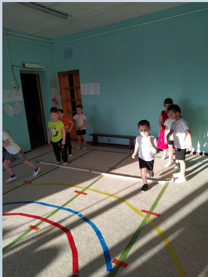
Физкультурный досуг «Спасатели спешат на помощь»