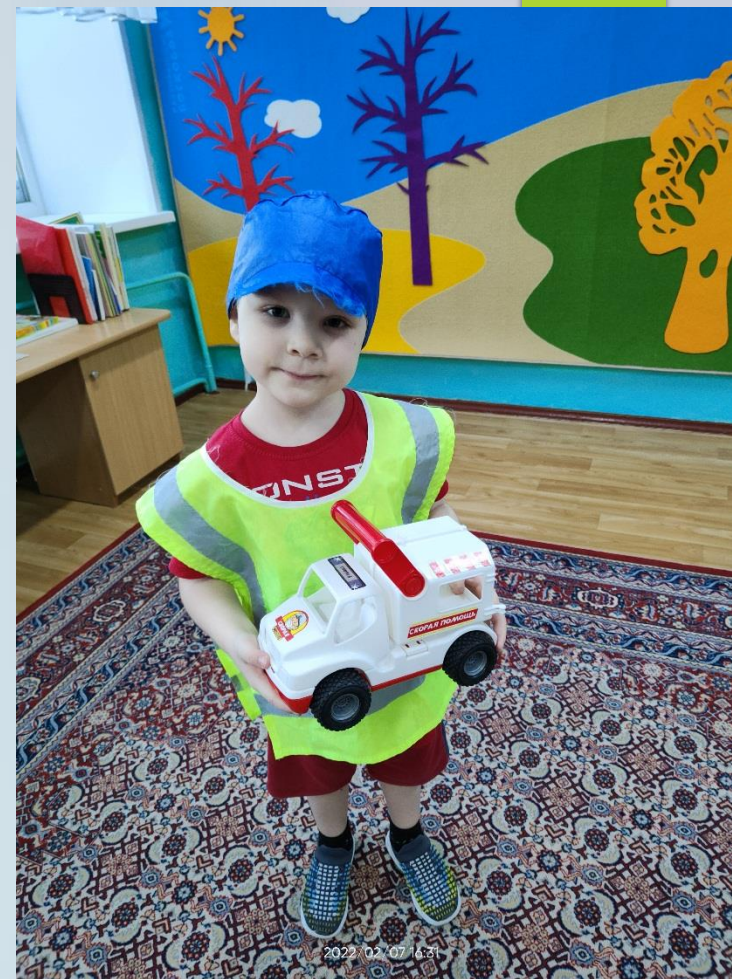
Сюжетно – ролевая игра «Мы - спасатели»