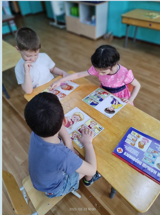
Д/Игра «Малыш поранился»