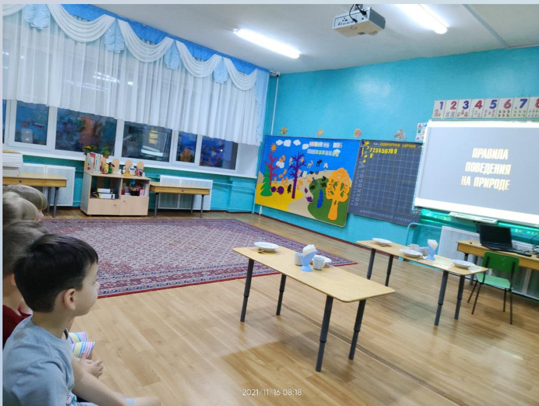
Презентация «Правила поведения на природе»