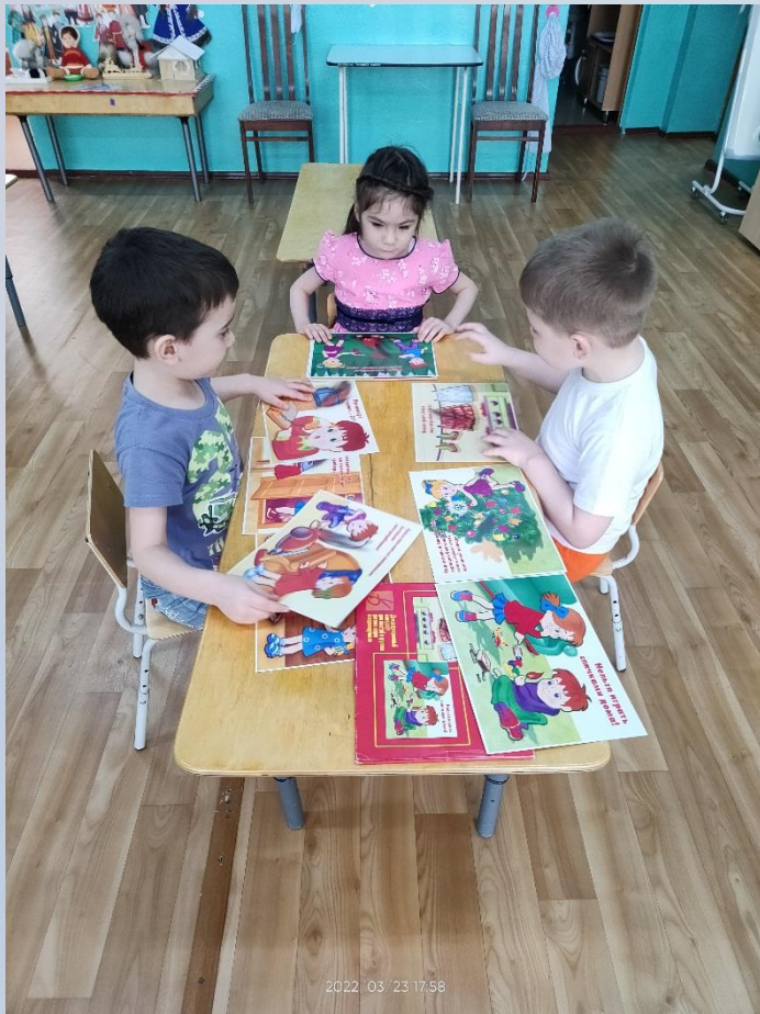
Д/Игра «Пожарная безопасность»