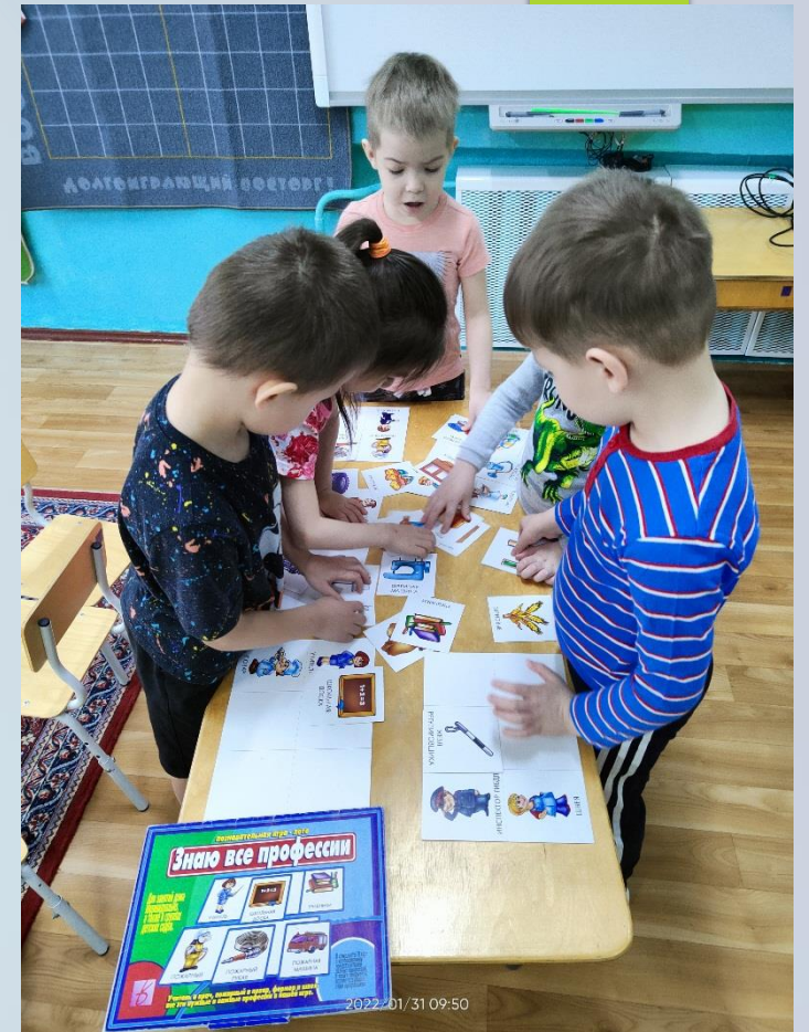
Д/И «Знаю профессии»