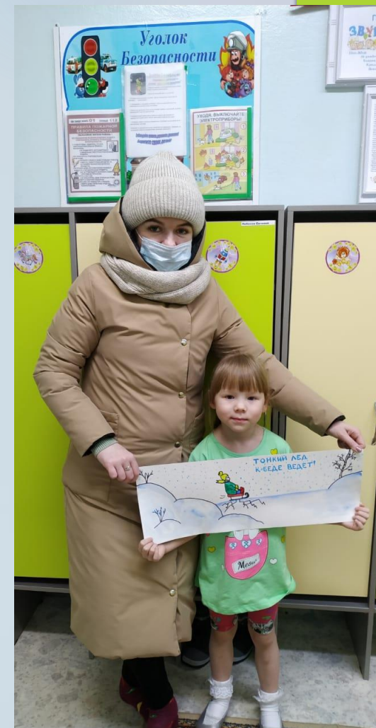
Работа с родителями «Опасный лед»